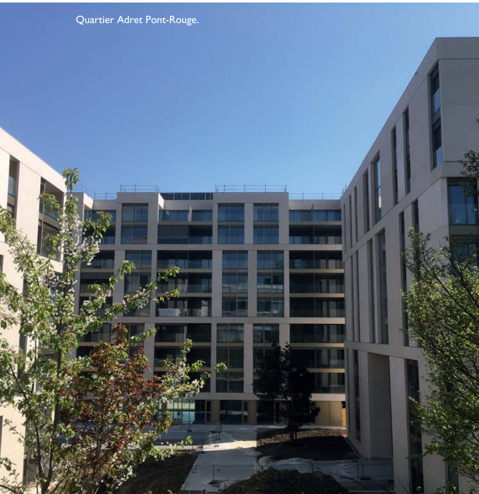
Quartier Adret Pont-Rouge.

Fondé en 1955, Perreten & Milleret SA est un bureau d'ingénieurs-conseils spécialisé en structures , génie civil et environnement , certifié ISO 9001, 14001 et OHSAS 18001. Pour compléter la gamme de ses prestations, il propose dorénavant des services en géotechnique afin de répondre dans la globalité aux demandes des clients. Avec sa cinquantaine de collaborateurs, il participe et pilote de nombreux projets d'envergure du canton.