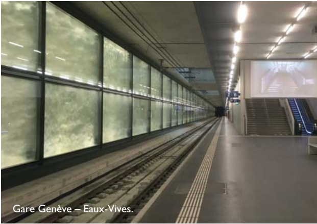
Gare Genève – Eaux-Vives.