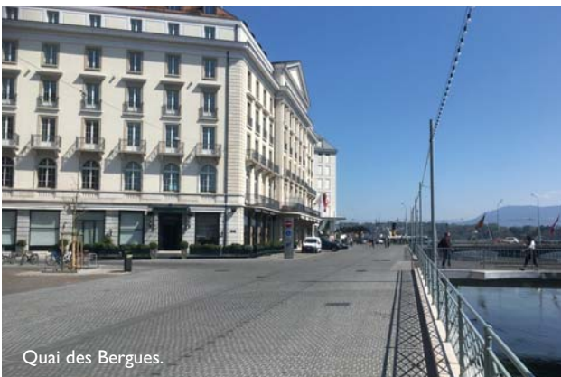
Quai des Bergues.

Dans le cadre des travaux anticipés pour l'extension de la capacité du nœud ferroviaire de la gare Cornavin, un Suivi Environnemental de Réalisation (SER) va être mené tout au long des travaux, avec la gestion de la pollution des matériaux terreux et excavation, des eaux de chantier, des mesures de protection du bruit et de l'air, des matières et substances dangereuses.