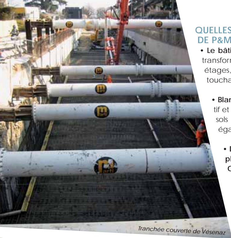
Tranchée couverte de Vézenaz