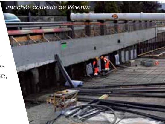
Tranchée couverte de Vézenaz

• CEVA – Lot 6 – Gare des Eaux-Vives: s'étend sur 750 m et comprend la construction d'une gare souterraine de 320 m de longueur, de 21 m de largeur et 16 m de profondeur, complétée de part et d'autre par des tranchées couvertes de transition franchissant l'avenue Théodore-Weber, la Rue Agasse, la route de Chêne et le chemin Frank-Thomas.