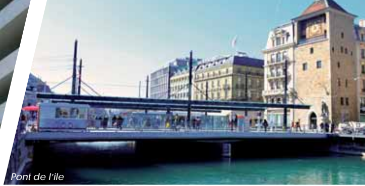
Pont de l'île